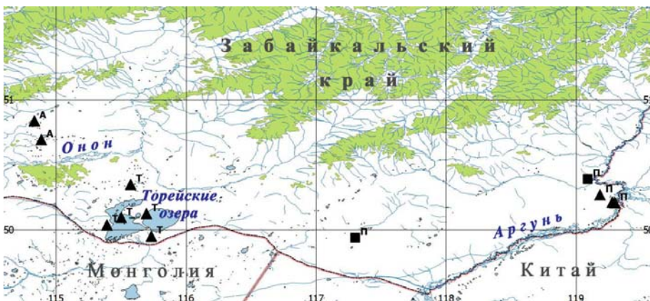
Рис. 1. Карта-схема распространения Asparagus brachyphyllus в Забайкальском крае: ■ – места произрастания, известные по литературным данным; ▲ – местообитания, установленные в ходе исследований. Обозначения районов: А – Агинская степь; Т – Торейские озёра; П – Приаргунье

В ходе полевых исследований нами выявлены 25 новых местонахождений A. brachyphyllus в окрестностях Торейских озёр (18 точек), в Агинской степи (четыре точки) и Приаргунье (три точки) (рис. 1; табл. 1). Указанные районы находятся южнее 51° с. ш.; все они степные, с большим или меньшим распространением солонцов и солончаков. Наиболее многочисленны местонахождения в районе Торейских озёр (рис. 2) в силу того, что в бессточном Торейском бассейне широко распространено явление почвенного засоления, большие площади занимают солонцы и солончаки. В Приаргунье и Агинской степи распространение этих типов почв ограничено. Данные по состоянию и эколого-фитоценотической приуроченности ценопопуляций вида представлены в табл. 2.