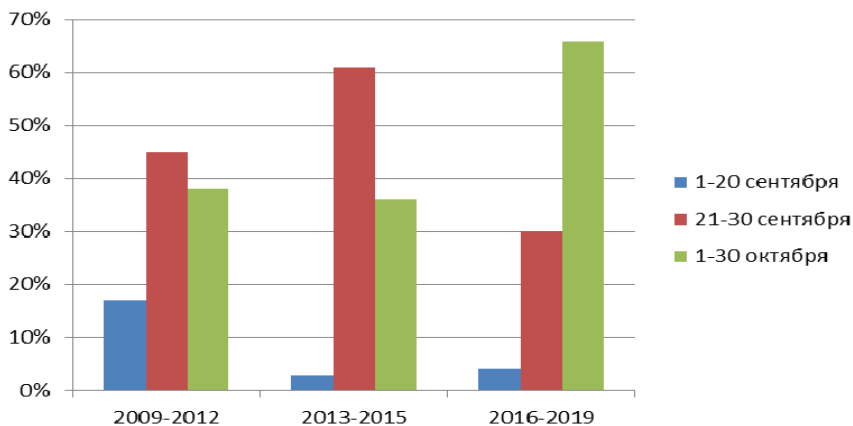
Рис. 1. Динамика сроков нерестовой миграции омуля посольской популяции в р. Большой Речке в 2009–2019 гг. по данным отлова производителей на рыбоводном пункте «Бельская грива»

С 2009 по 2019 г. прослеживается тенденция постепенно нарастающего запаздывания нерестовой миграции (рис. 1).