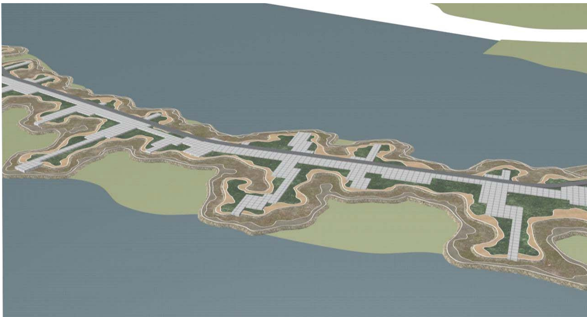
Рис. 3. Проект набережной р. Ангары – рекультивация теплотрассы на пойменной террасе