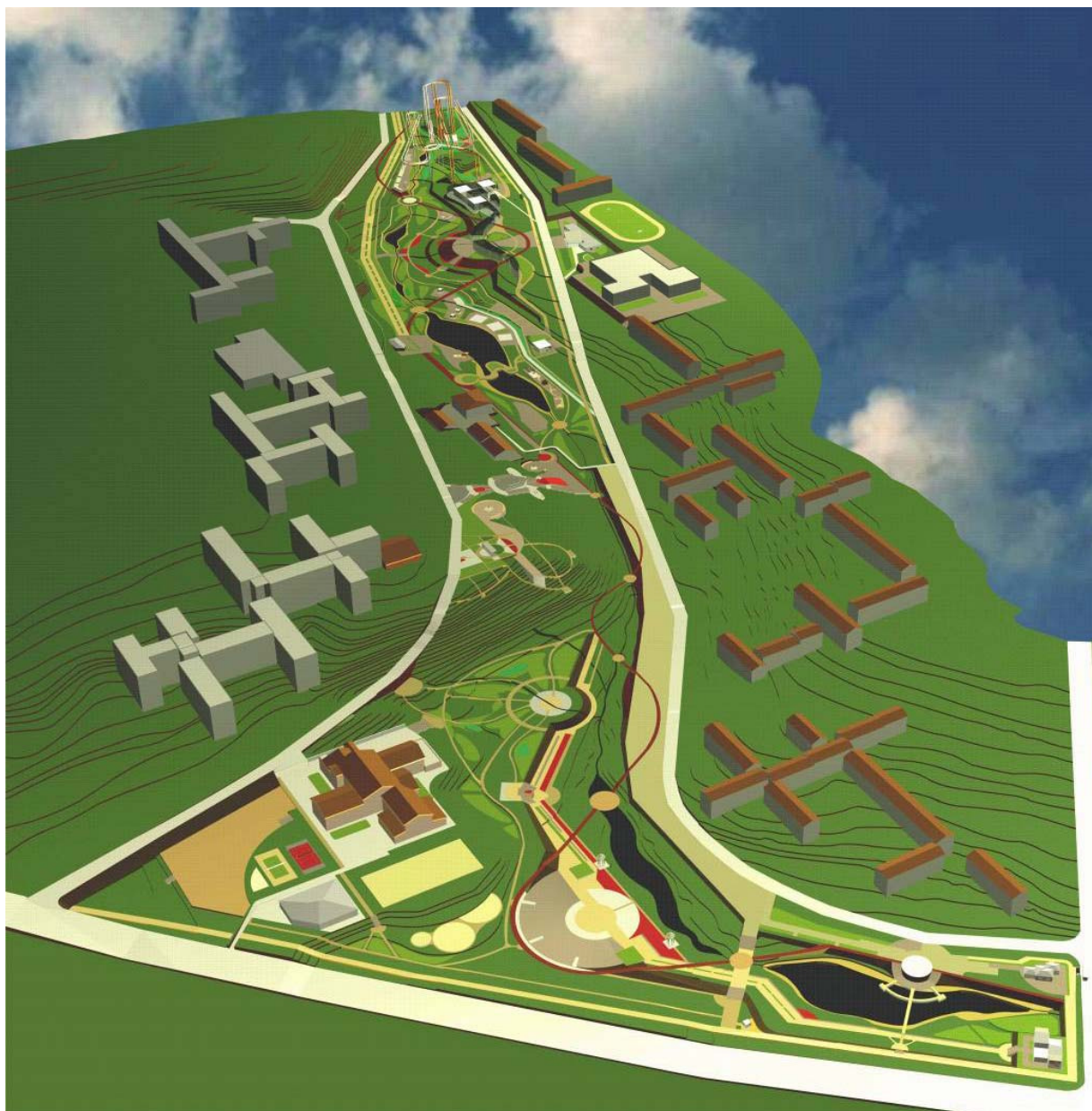
Рис. 5. Общий вид ландшафтно-рекреационного обустройства долины ручья Падь Долгая в Иркутске. Дипломный проект Э. Петрас. Руководитель проф. А. Г. Большаков

2. В состав прибрежных территорий входят прибрежная защитная полоса, прибрежная полоса общего пользования и водоохранная зона, а также рекреационная зона. Рекреационная зона может быть шире водоохранной зоны.