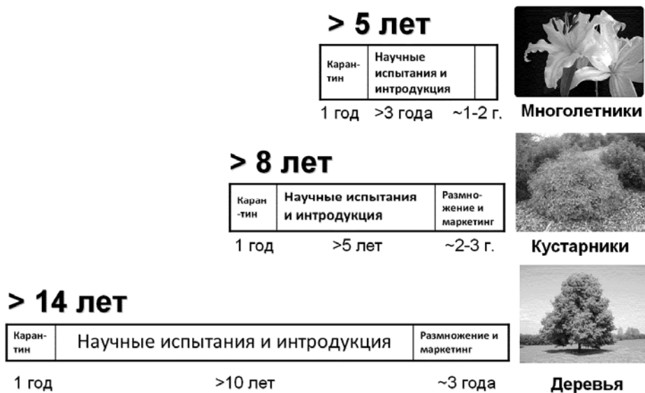
Рис. 1. Цикл введения в культуру различных групп растений

испытания и востребованные среди потребителей, после их вовлечения в экономический оборот фактически становятся инновационными продуктами. Успешно интродуцированные растения и технологии их использования – это наукоёмкие инновации, т. е. нововведения, комплексные процессы создания, распространения и использования новшества для повышения эффективности, экономичности, улучшения качества жизни людей, улучшения экологической обстановки. Именно поэтому такая интродукционная деятельность относится к инновационной, которая должна быть органично встроена в содержание миссии современного ботанического сада.