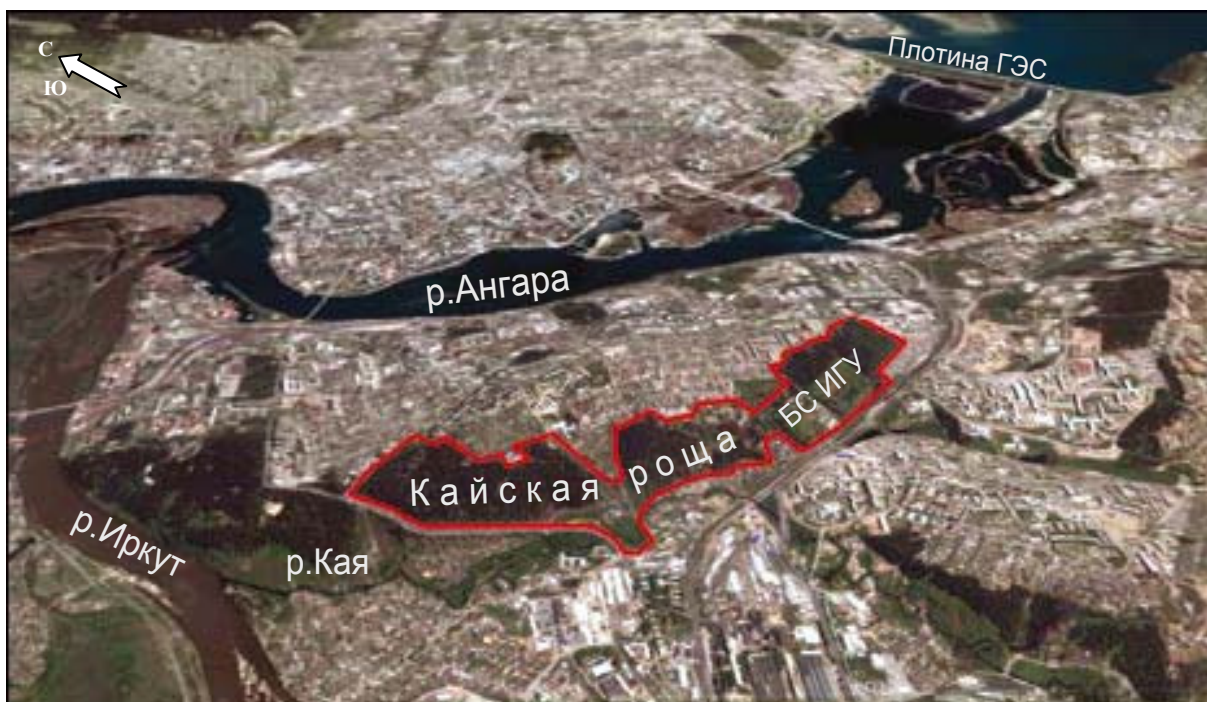
Рис. 4. Панорама г. Иркутска с обозначением границ предполагаемого развития проекта «Иркутского ботанического сада» на территории крупнейшего внутригородского лесного массива Кайской рощи на основе экологически значимых ресурсов Ботанического сада ИГУ

В настоящее время в развитых и развивающихся странах прослеживается тенденция модернизации традиционных ботанических садов, особенно университетских, и их трансформации в социально ориентированные природоохранные институты нового типа. С помощью специально разработанных рекреационных мероприятий, туристических, образовательных программ, путём экологического просвещения в них происходит духовная реабилитация населения. Следовательно, в глобальной системе социальных координат ботанические сады следует также рассматривать в качестве экологически значимых ресурсов, содействующих устойчивому развитию общества и представителей всех социальных и возрастных групп населения – от самых маленьких до пожилых граждан [2; 16; 20]. Будучи местом с самой высокой концентрацией живых коллекций из разных стран, ботанический сад помогает лучше понимать этноботанические традиции и культуру людей разных национальностей, поэтому позитивное влияние на международные отношения также должно становиться частью миссии ботанического сада. Яркий пример этого – возможности соединения в ботаническом саду особых ландшафтных участков с разными популярными стилями национальных этноботанических садов (французского, русского, японского, корейского, исламского, библейского и др.), взаимообога-