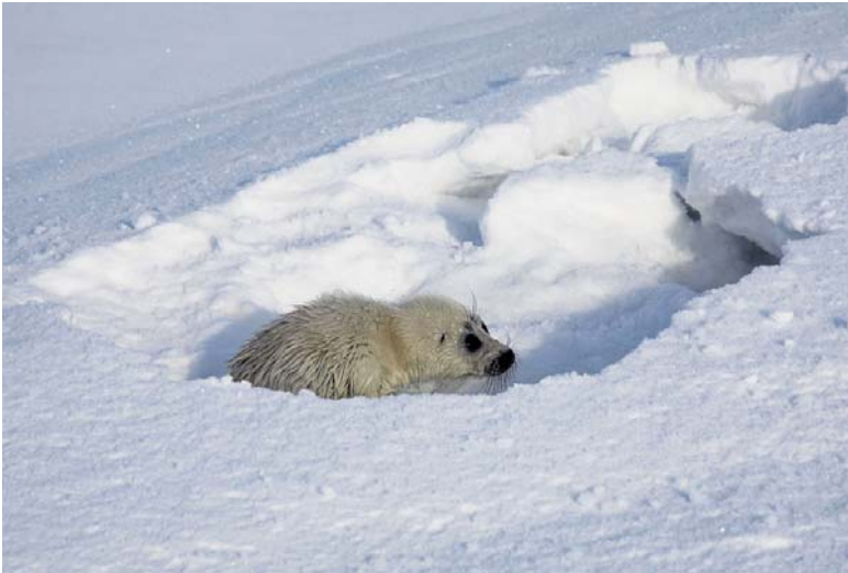
Рис. 3. Белёк байкальской нерпы

Вероятно, такие процессы уже происходят в последние годы, хотя опубликованных сведений пока нет. Важно, что в недалекой перспективе «недокармливание» может иметь значительные негативные последствия для функционирования всей популяции нерпы [Пастухов, 1993], поскольку недостаточно большие «стартовые» масса и размеры тела будут сказываться на дальнейшем росте и половом созревании животных, а также качестве потомства, и в этом аспекте потепление можно рассматривать как реальную угрозу.