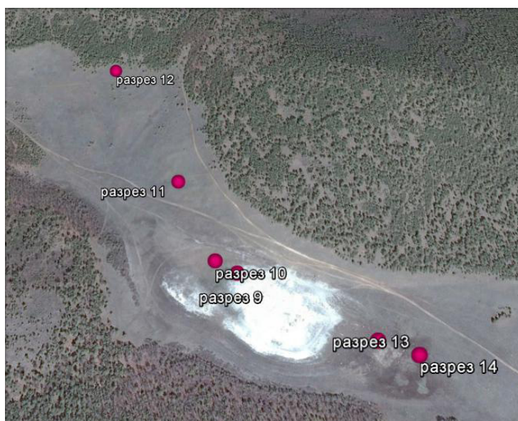
Рис. 1. Карта-схема заложения почвенных разрезов в районе оз. Шара-Нур (о. Ольхон, оз. Байкал).

Обследование почв Ольхона проводилось в августе 2014 г. Отбор почвенных образцов проводился согласно общепринятым в почвоведении методам. Были заложены 14 почвенных разрезов в разных районах острова: м. Хобой (разрезы 1, 2), пос. Узуры (разрезы 3, 4), м. Шибетский (разрезы 5, 6), м. Ташкай (разрезы 7, 8), оз. Шара-Нур (трансект-катена, разрезы 9–14) (рис. 1, табл. 1).